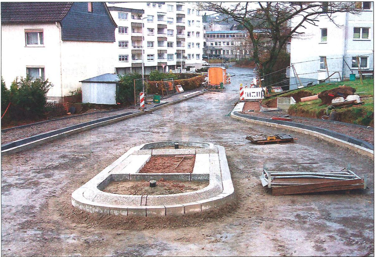
Die neue Fahrbahn des Siepener Wegs mit Verkehrsinseln, Bordsteinen und Gehwegen ist vom Einmündungsbereich Oststraße bis zur Dränkerkampstraße bereits weitgehend erstellt. Noch in diesem Jahr soll asphaltiert werden. ■ Fotos: vom Hofe